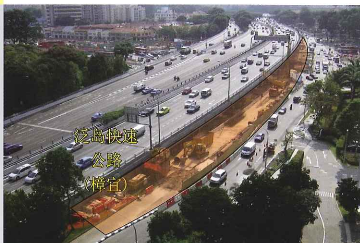
拟议中汽车天桥的位置 (从惹兰哥南亚逸取景)

为进行有关工程，我们必须在某些晚间装置预制的混凝土梁。在进行这项工程时，我们必须暂时关闭某些道路和进行临时道路改道。但在这之前，我们将事先进行有关的协调工作、发出通告以及在适当的地点放置指示牌以尽量减少工程所带来的不便。