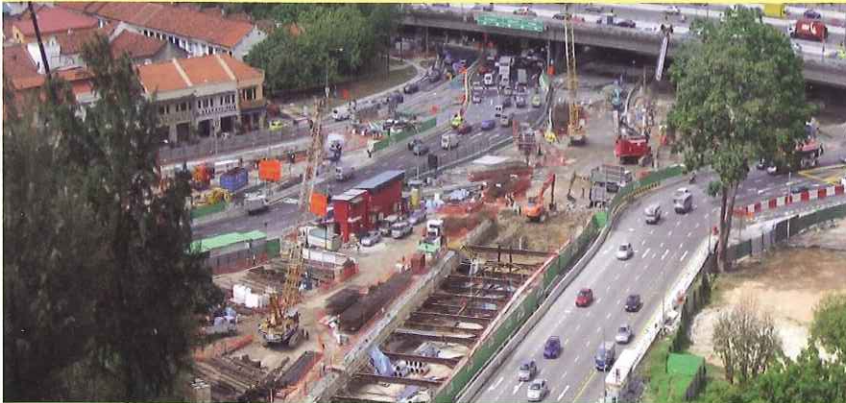
汽车隧道的挖掘工程 (明地迷亚路)

这项工程的汽车隧道的挡土墙已全部完成，工程进展得非常顺利。目前隧道的挖掘和建造工作正在全面展开。